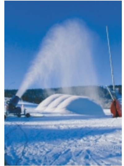
Die Propellermaschine IQ 505 von S.NOW reüssiert in Ostdeutschland.

Hier kam die S.NOW nicht etwa durch den günstigeren Preis oder das außerordentlich niedrige Gewicht von max. 300 kg zum Zug, sondern laut Fröhler aufgrund der Schneirate im Grenzbereich, des o. a. Services und der hohen Produktqualität, auf welche die S.NOW Schneesysteme setzt.